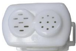
Насадка с формами для пасты

Внимание! Убедитесь, чтобы тесто было не слишком влажное.