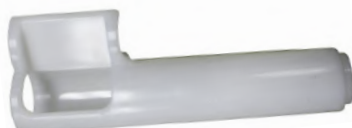
Трубка для пасты