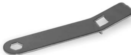
Специальный ключ необходим для работ с триммерной головкой