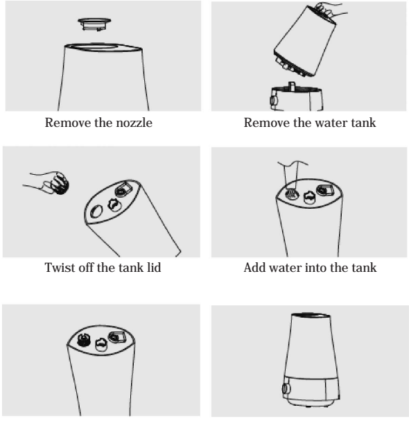
Twist back the tank lid