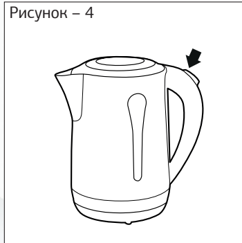
Рисунок – 4

— Включите чайник, нажав кнопку (переведя выключатель в положение 1).