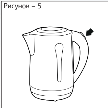
Рисунок – 5

— Перед снятием с базы убедитесь в том, что чайник выключен (переключатель в положении 0).