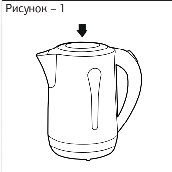
Рисунок – 1