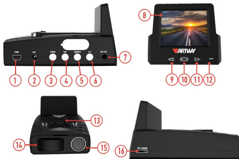
СХЕМА КОМБИНИРОВАННОГО УСТРОЙСТВА ARTWAY