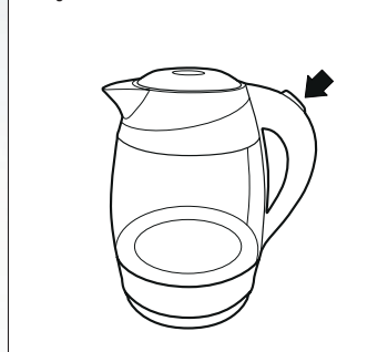
Рисунок - 5

— Перед снятием с базы убедитесь в том, что чайник выключен (переключатель в положении 0).