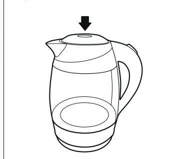
Рисунок - 1