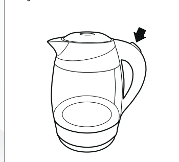
Рисунок - 4

— Включите чайник, нажав кнопку (переведя выключатель в положение 1).