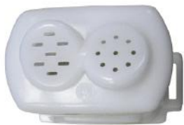
Насадка с формами для пасты

Внимание! Убедитесь, чтобы тесто было не слишком влажное.