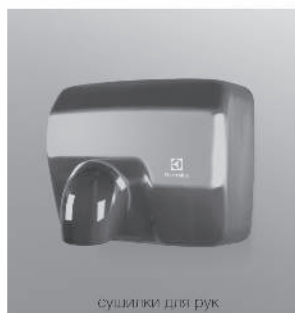
сушилки для рук