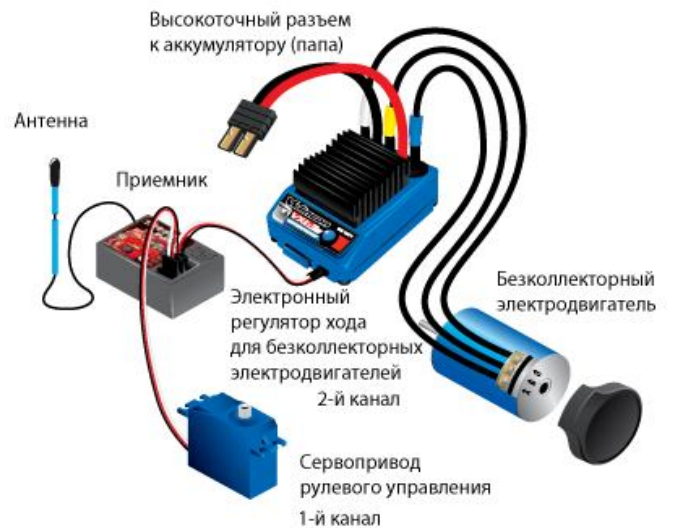
Схема подключения бесколлекторного электродвигателя