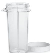
16oz. BPA-Free Blending Cup with Lid (#PB02BF)