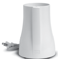
Motor Base (#PB01)

(Please call 888-254-7336 or visit www.tribestlife.com for availability and pricing)