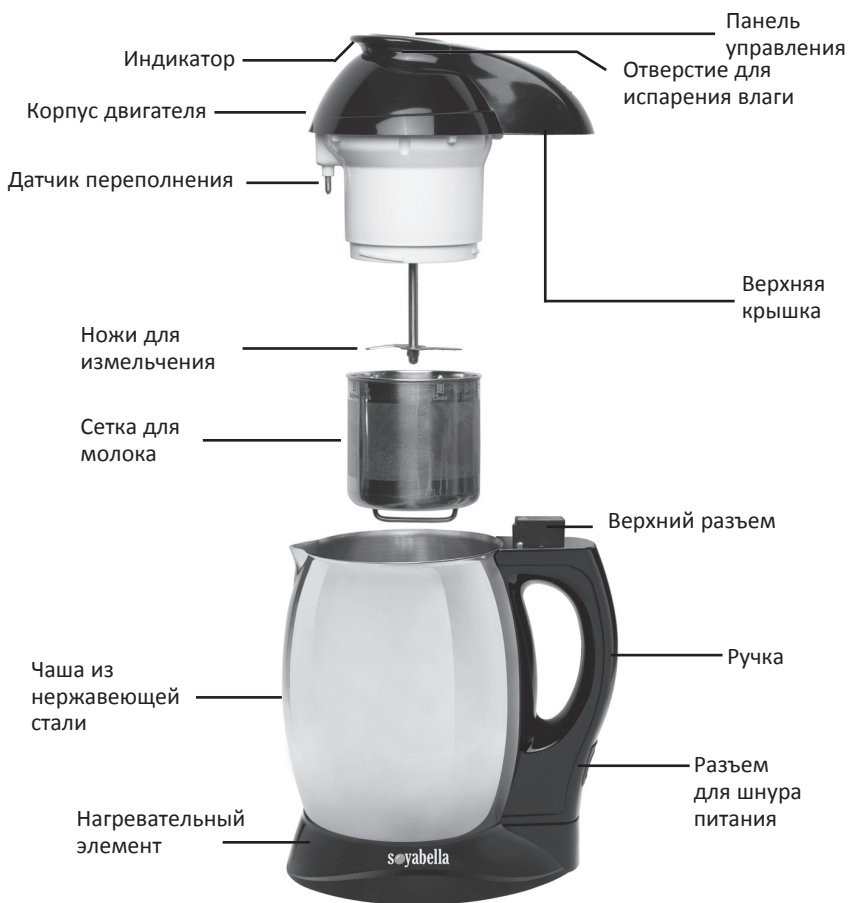
Сетка для рисовой пасты