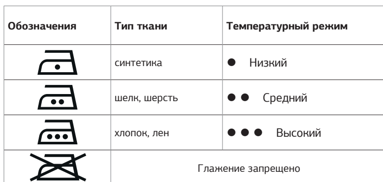
Таблица может быть использована только для гладких тканей. Если на ткани присутствует рельеф, оборки, нашивки и прочие декоративные элементы, рекомендовано производить глажение при низких температурах.

Перед началом работы изучите информацию о допустимых режимах глажения на ярлыке изделия. В случае если ярлык с рекомендациями отсутствует, но известен материал изделия, обратитесь к таблице.